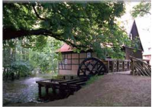
Suderburg – ein idyllischer Ort für Naturliebhaber

Da das Studierendenwohnheim direkt auf dem Campus liegt, finden sich hier ideale Bedin-