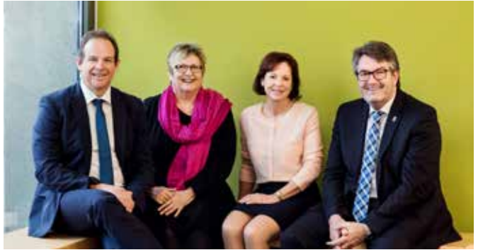
Das Präsidium der Ostfalia