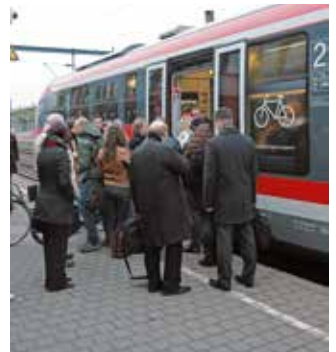
Mobil durch den Nahverkehr des VRB – die Standorte entspannt erreichen