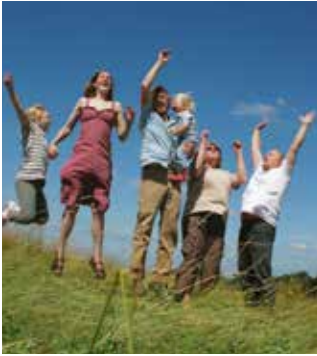
Die Ostfalia fördert eine familienfreundliche Hochschulkultur