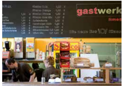
... und kalten Getränken

Warme Mahlzeiten, Getränke und Snacks bieten an allen Standorten der Hochschule Mensen und/oder Cafeterien.