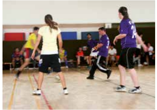
Futsal, eine Variante des Hallenfußballs mit südamerikanischem Ursprung, sorgte beim Sporttag am Campus Wolfenbüttel für gute Stimmung.

Aber auch die Standorte der Hochschule haben ihren besonderen Reiz. Sie verbinden die Nähe zu namhaften Unternehmen und Forschungseinrichtungen mit einem breitgefächerten Kulturangebot sowie vielfältigen Ausflugsmöglichkeiten. Welche Lokalitäten vor Ort für einen unterhaltsamen Abend in Frage kommen, zeigt Ihnen übrigens das Erstsemesterprojekt bei einer kleinen Kneipentour.