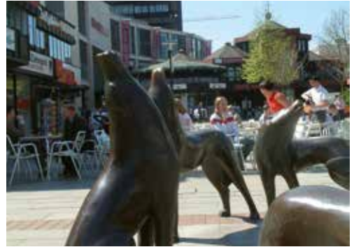
Die Wolfsburger Wölfe auf der Shoppingmeile

zahlreichen Cafés und Geschäften ist ein Anziehungspunkt, auch die Open-Air-Veranstaltungen des „KulturSommers“ im Schloss Wolfenbüttel und der nahegelegene Naturbadesee Fämmelsee mit über 13.000 Quadratmetern Wasserfläche sorgen für Lebensqualität und Freizeitvergnügen in Wolfenbüttel. Mehr Informationen finden Sie unter www.wolfenbuettel.de .