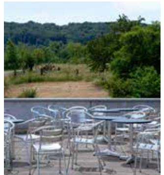
Mensa in Suderburg (oben) und Sonnenterrasse in Salzgitter