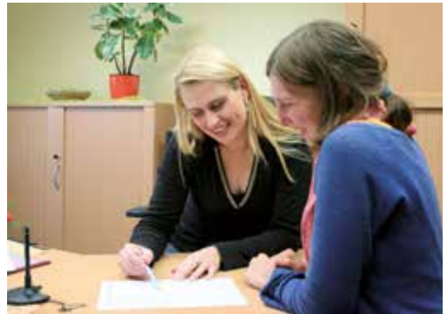
Beratung in schwierigen Situationen ist kostenlos