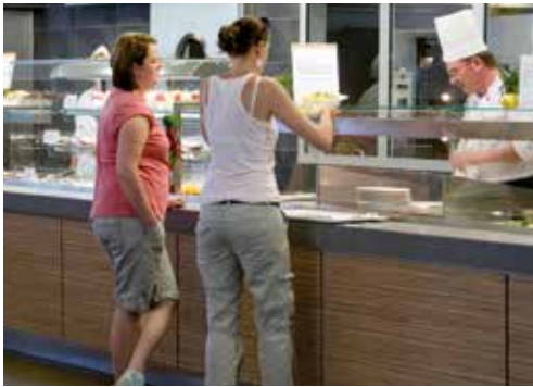
Ein umfangreiches Angebot an warmen Speisen ...