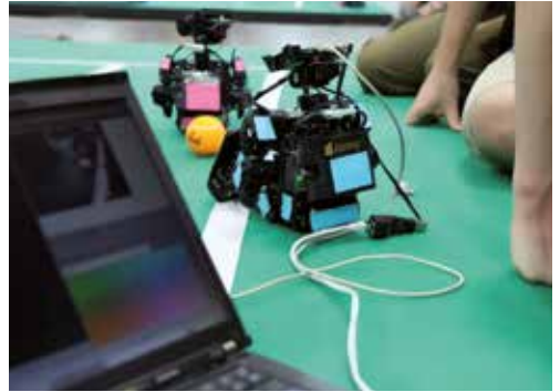
Die Humanoiden des RoboCup-Teams der Ostfalia

Beim Team wob-racing stehen die Konstruktion, Fertigung und Erprobung von Rennwagen im Mittelpunkt. Studierende mit einer Leidenschaft für Motorsport sind in diesem Team herzlich willkommen. Kontakt: info@wob-racing.de