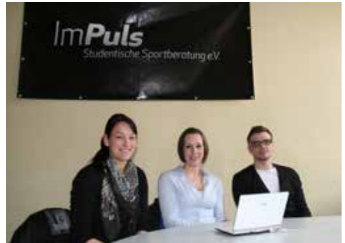
ImPuls – Studentische Sportberatung e.V.