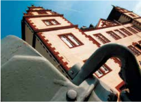
Das Schloss Salder in Salzgitter – attraktiver Ort für vielseitige Ausstellungen

Firma IKEA. Aber in den 31 Stadtteilen Salzgitters gibt es neben weiteren Großunternehmen wie MAN, der Salzgitter AG und zahlreichen mittelständischen Betrieben auch reizvolle Angebote für Erholungssuchende: zum Beispiel den staatlich anerkannten Luftkurort Salzgitter Bad mit einer der stärksten Thermalsolequellen Deutschlands. Unter www.salzgitter.de erfahren Sie im Internet mehr über diesen Standort.