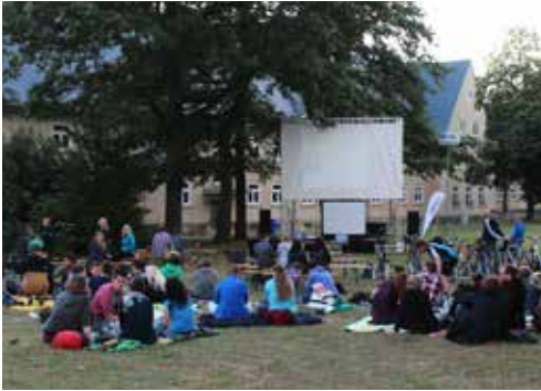
Fahrradkino - auch das macht der Filmclub der Ostfalia möglich.