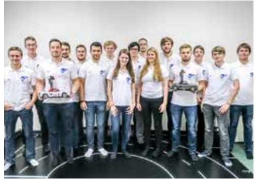
Ein Team für ein (Modell)Auto