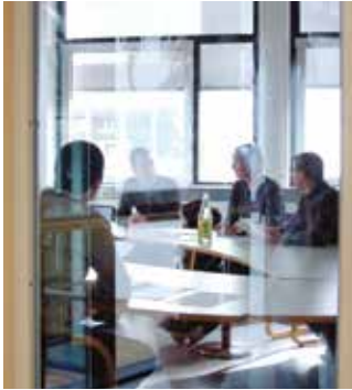
Raum für Diskussionen – Studierende können das Hochschulleben aktiv mitgestalten

Die studentische Selbstverwaltung – eine rechtsfähige Teilkörperschaft unserer Hochschule – setzt sich aus folgenden Einrichtungen zusammen: