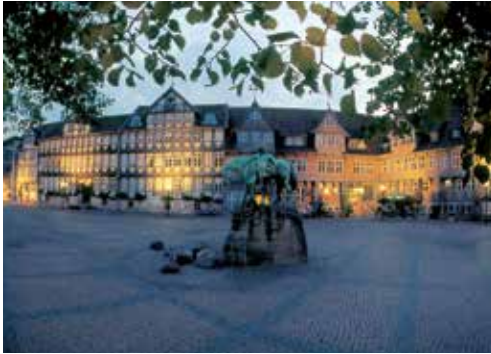
Aufwendige Fachwerk- und Backsteinfassaden – das Wolfenbüttler Rathaus am Abend