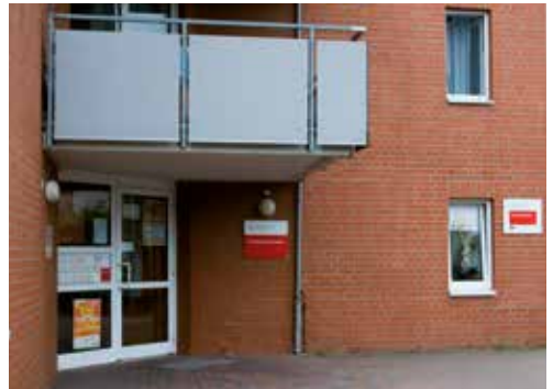
Die Wohnheime des Studentenwerks

Gute Erfolgsaussichten haben Sie zudem, wenn Sie selbst eine Anzeige aufgeben oder in der Ostfalia am Schwarzen Brett einen Aushang mit Ihrem Gesuch anbringen. Eine Alternative zur Privatunterkunft sind die studentischen Wohnheime, die es an allen vier Hochschulstandorten – also in Wolfenbüttel, Wolfsburg, Suderburg und Salzgitter – gibt.