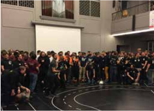
Auf der Rennstrecke erfolgreich: Die autonomem Fahrzeuge des OstfaliaCup-Teams.