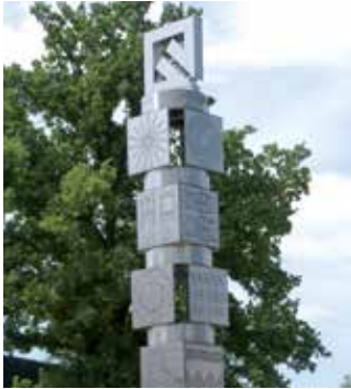
Der „Turm der Technik“ am Campus Wolfenbüttel