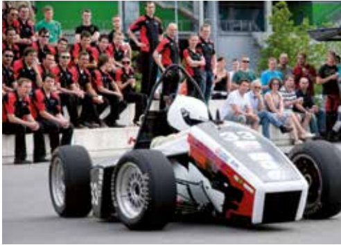
Rennwagen sind die Leidenschaft des Teams wob-racing