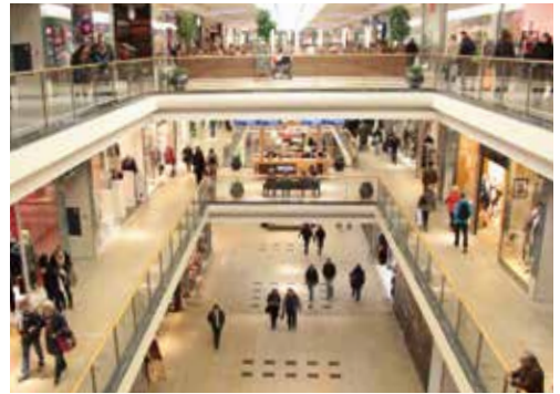
Modern Shoppen in Braunschweigs Innenstadt

In Braunschweig entwickelte sich die im Jahr 1905 gegründete Christlich-Soziale Frauenschule zur Höheren Fachschule für Sozialarbeit des Landes Niedersachsen. Dreiundzwanzig Jahre nach der Gründung dieser Einrichtung entstand das Technikum in Wolfenbüttel. Diese private Lehranstalt bot ein Studium sowie staatlich anerkannte Abschlussprüfungen in den Bereichen Maschinenbau und Elektrotechnik an. 1968 wurde aus dem Technikum eine Staatliche Ingenieurakademie bevor es 1971 den Status einer Fachhochschule erlangte. Mit dem Zusammenschluss mit der Höheren Fachschule in Braunschweig entstand so im selben Jahr die Fachhochschule bzw. die heutige Hochschule Braunschweig/Wolfenbüttel. Die Erfolge der Hochschule zeigen sich unter anderem an stetig wachsenden Studierendenzahlen sowie an der Gründung zahlreicher weiterer Fachbereiche: Von 1971 bis heute ist die Anzahl der Studierenden von 850 auf rund 13.000 angewachsen. Und mit ihren mittlerweile zwölf Fakultäten ist die Hochschule darüber hinaus inzwischen an vier