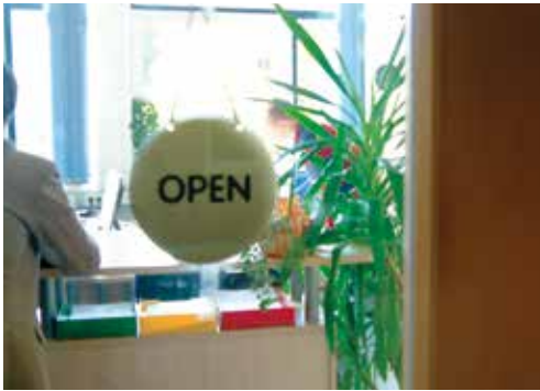
Geöffnet für die Anliegen der Studierenden